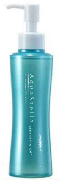
アクアステラ クレンジング オイル (メイク落とし) 150mL ビジネス会員価格: 5,400円 4,000ポイント プロトン倶楽部(愛用会員): 5,832円 / 希望小売価格: 7,020円